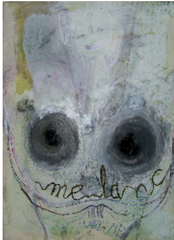
Melancholia (Marry me), 2007 Öl, Graphit, Kreide, Papier auf Leinwand, 100 x 80 cm

Bismarckstraße 6 66111 Saarbrücken Telefon +49 (0)681/ 59 53 868 www.galeriebesch.de i.besch@galeriebesch.de