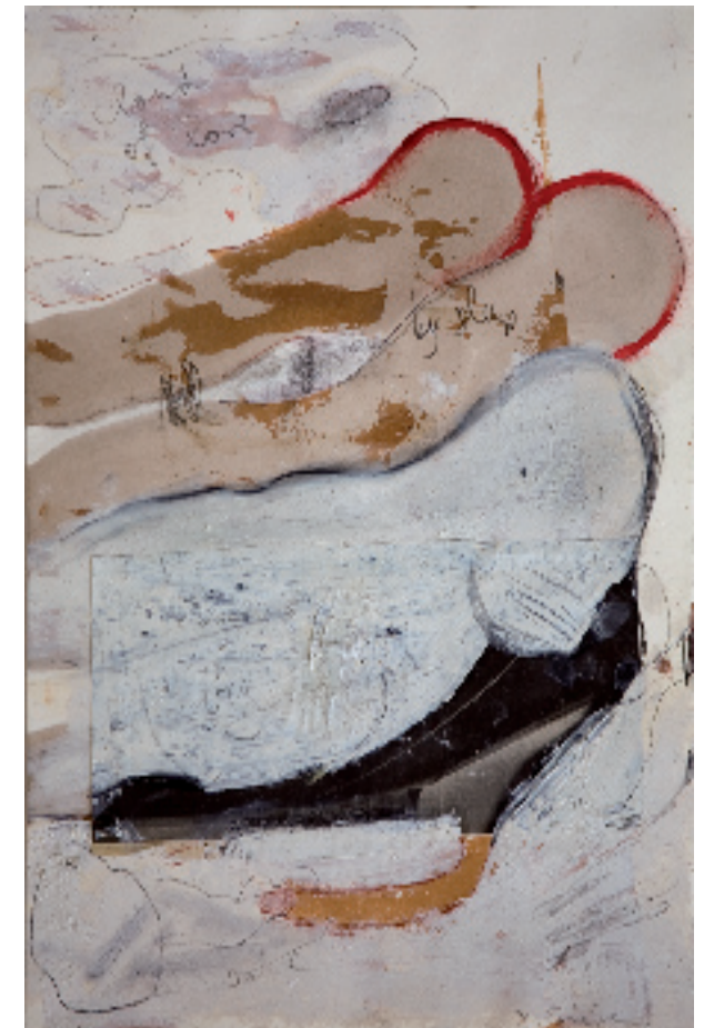
Cloud of love by sleep, 2006 Öl, Asphalt, Graphit, Kreide auf Papier, 42 x 30 cm