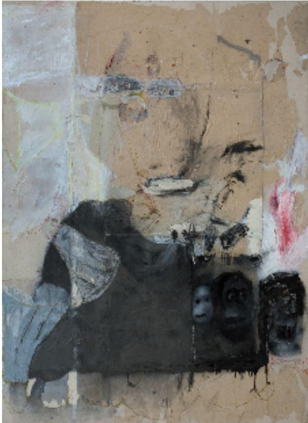
Trinity und ich, 2007 Öl, Graphit, Kreide, Papier und Leinwand, 190 x 140 cm