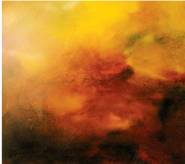
Ohne Titel, 2002, Acryl auf Leinwand 100 x 100 cm Titelbild: Ohne Titel, 2007, Acryl auf Leinwand, 150 x 100 cm

Ausstellungsdauer 18. Januar bis 20. Februar 2009