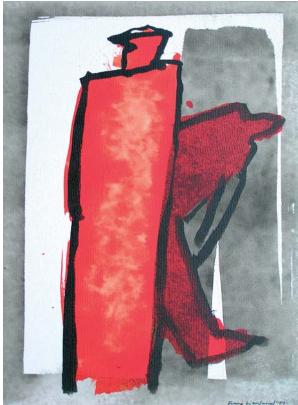
Raymond Weiland • Sigrid Haag Body and Soul Soul and Body