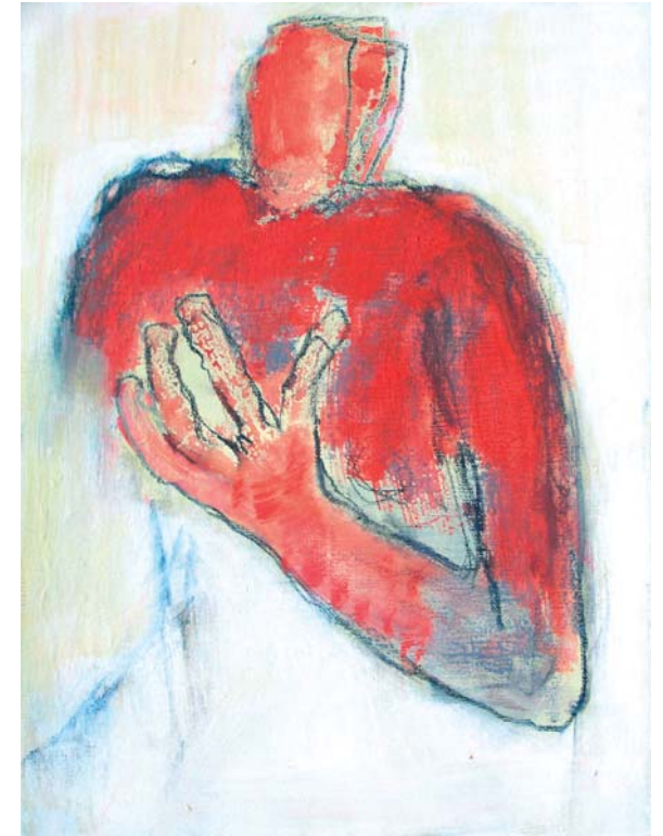
Sigrid Haag, Ohne Titel, 2011, Mischtechnik auf Papier, 40 x 30 cm

galerie besch / Dr. Ingeborg Besch Bismarckstraße 6 66111 Saarbrücken Telefon +49 (0) 68 1 / 59 53 868 www.galeriebesch.de i.besch@galeriebesch.de