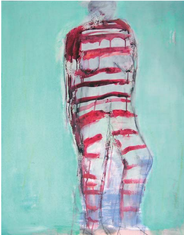
Raymond Weiland • Sigrid Haag Body and Soul Soul and Body