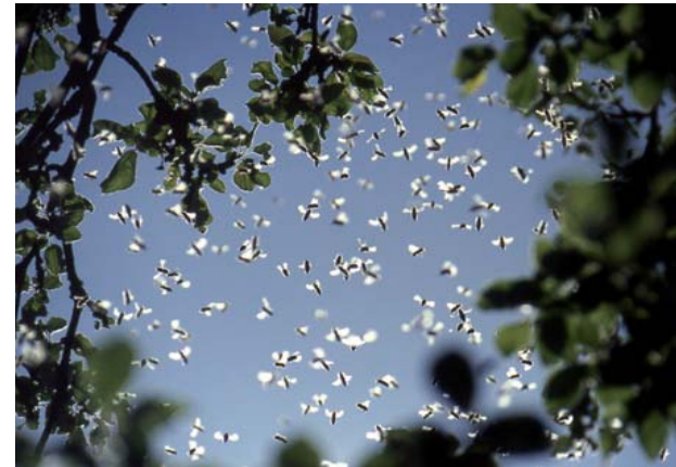
Aus dem Bienenleben/ Schwarm, 2009, Fotodruck auf Kunststoffplatte, 70 x 100 cm

Die Bienen stehen seit 22 Jahren im Mittelpunkt des künstlerischen Schaffens von Jeanette Zippel. Die unmittelbare Beschäftigung mit Bienenvölkern in ihrer kleinen Imkerei ist Inspirationsquelle für Zeichnungen, Bilder, Objekte, Skulpturen, Raum- und Videoinstallationen. Im In- und Ausland gestaltet sie Gartenanlagen mit belebten Bienenskulpturen.