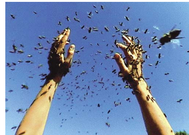
Honighände, Bild aus dem Videoloop Honighände, 2003