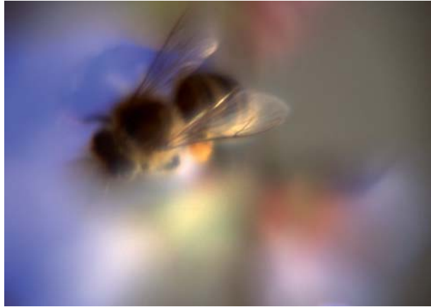
Aus dem Bienenleben / Nektarsuche, 2009, Fotodruck auf Kunststoffplatte, 70 x 100 cm Titelbild: ...fliegen.../10, 2008, Tusche auf Papier, 130 x 130 cm