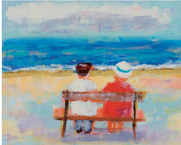
Ulrike Hansen, Paar, 2010, Eitempera auf Leinwand, 80 x 100 cm Titelbilder: Ulrike Hansen , Im Pünktchenkleid, 2010, Eitempera auf Leinwand, 40 x 30 cm, Maren Klemmer , Ohne Titel, 2010, Mischtechnik auf Baumwolle, 30 x 30 cm