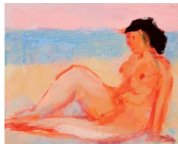
Ulrike Hansen , Kleine Frau, 2010, Eitempera auf Leinwand, 24 x 30 cm