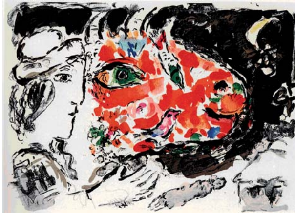
Après l'hiver, 1972, Farblithographie, 32 x 44 cm, Mourlot 651 Titelbild: Der Sonntag, aus: Paris - Zyklus, 1954, Farblithografie 38,1 x 27,8 cm, Mourlot 098