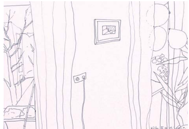
Leslie Huppert, Küche II 20.02.08, 2008, Tinte auf Papier, 21 x 29,7 cm

Es spricht: Dr. Andreas Bayer Kunsthistoriker, Hochschule der Bildenden Künste Saar