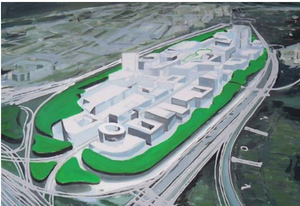
Ursel Kessler, Die neue Stadt, Acryl und Lack auf Leinwand, 70 x 100 cm