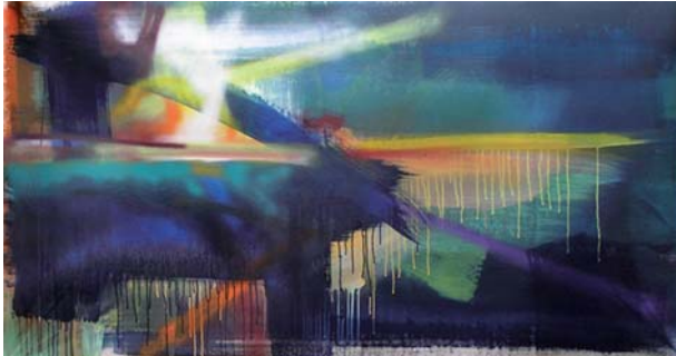
Gisela Zimmermann, DY 3'8, 2008, Acryl, Tusche, Lack auf Baumwollsegeltuch, 116x210cm Titel: Klaus Harth, Artig Saraviensis, 2008, Wachskreiden, Grafit, Öl auf Papier, 42 x 55 cm