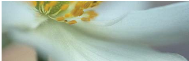
Mechthild Schneider, O. T., 2008, Farbfotografie, 50 x 150 cm