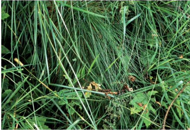
Ingeborg Knigge, Wiesenstück 30605-III#11, 2005, Farbfotografie, 30 x 45 cm