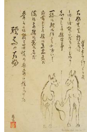
Seiji Kimoto, Die beiden Esel, Der Lattenzaun, Kalligraphie, 2002, Tusche auf Papier, je 70 x 50 cm