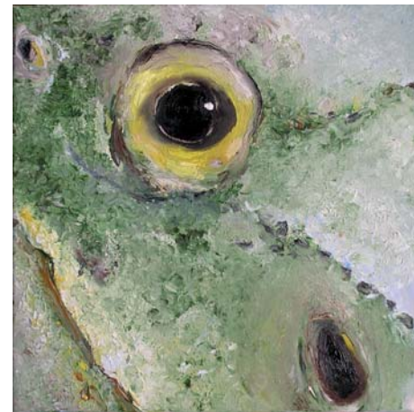
Vera Kattler, O. T., 2008, Öl auf Leinwand, 30 x 30 cm