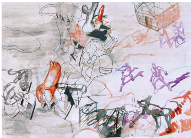
Volker Lehnert, O. T., Dschungel, 2008, Mischtechnik auf Papier, 21 x 29,7 cm