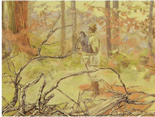
Eckendorf – Erbsenkamp, 2007, Öl auf MDF, 30 x 40 cm