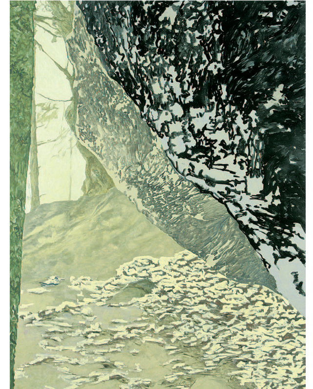
Achim Beier / Auf ins Grüne Landschaftsmalerei im 21. Jahrhundert

Titelbild: Kulmitzen II, 2007, Öl auf Leinwand, 145 x 120 cm