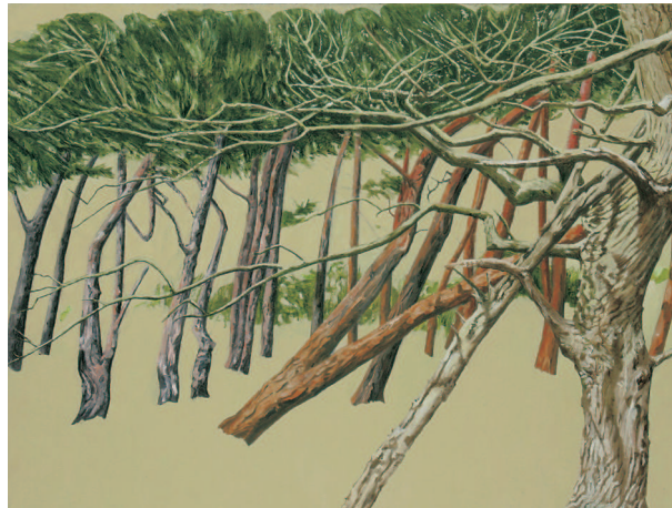
Lütjensee, 2006, Öl auf Leinwand, 105 x 145 cm