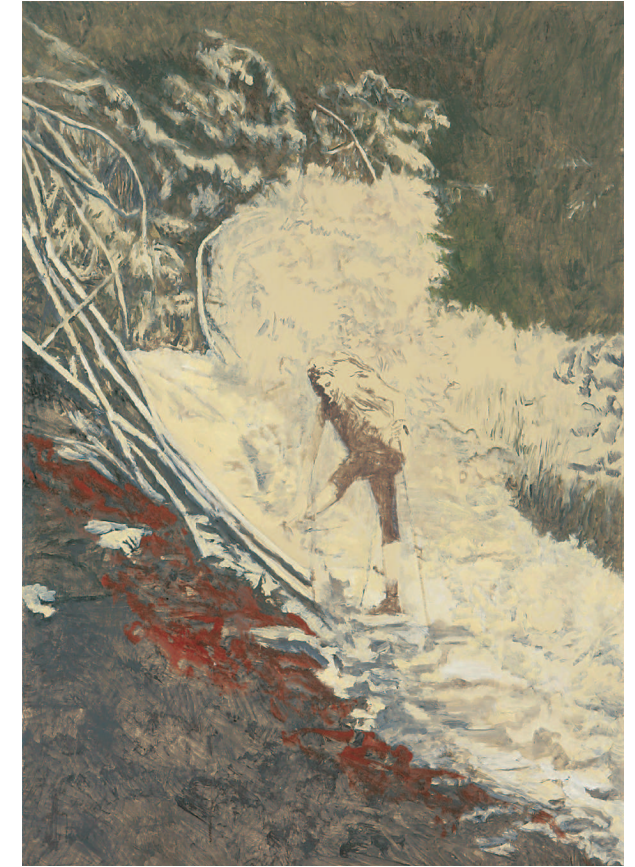
Reute – Frauenwald, 2007, Öl auf Leinwand, 80 x 60 cm